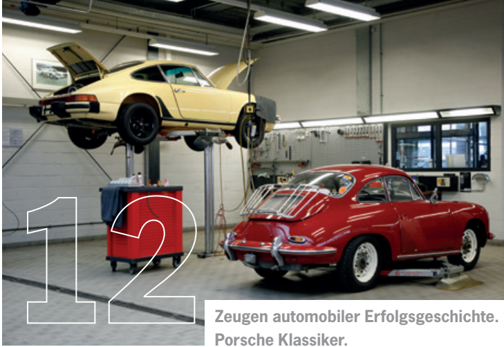
Zeugen automobilier Erfolgsgeschichte. Porsche Klassiker.