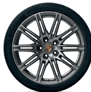
21-Zoll Cayenne SportEdition Rad lackiert in Platinum (seidenglanz)

VA: 10 J x 21 ET 50 HA: 10 J x 21 ET 50 VA: 295/35 R 21 (107Y) XL HA: 295/35 R 21 (107Y) XL