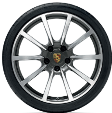
20-Zoll Carrera Classic Rad

VA: 8 J x 20 ET 57 HA: 9,5 J x 20 ET 45 VA: 235/35 ZR 20 (88Y) HA: 265/35 ZR 20 (95Y)