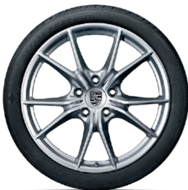
20-Zoll Carrera S Rad

Erhältlich für alle 911 Carrera und 911 Carrera S Modelle (Typ 991 II). In anderen Abmessungen erhältlich für 911 Carrera 4 und 911 Carrera 4S Modelle (Typ 991 II).