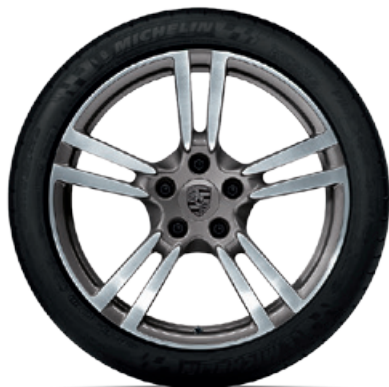
20-Zoll 911 Turbo II Rad

Erhältlich für alle 911 Carrera und 911 Carrera S Modelle (Typ 991 II). In anderen Abmessungen erhältlich für 911 Carrera 4 und 911 Carrera 4S Modelle (Typ 991 II).