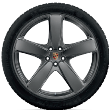
19-Zoll Sport Classic Rad lackiert in Platinum (seidenglanz)

VA: 8 J x 19 ET 21 HA: 9 J x 19 ET 21 VA: 235/55 R 19 (101Y) HA: 255/50 R 19 (103Y)