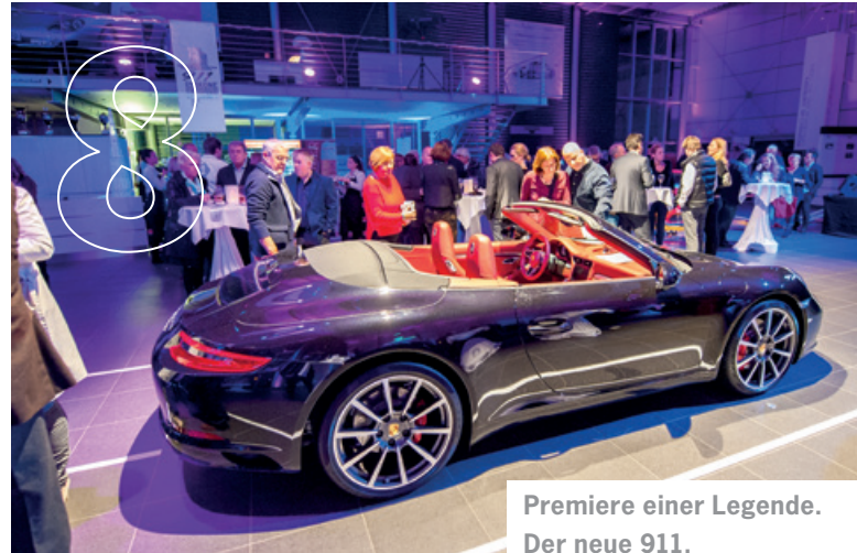
Premiere einer Legende. Der neue 911.

Liebe Porsche Kunden und Freunde des Porsche Zentrum Koblenz,