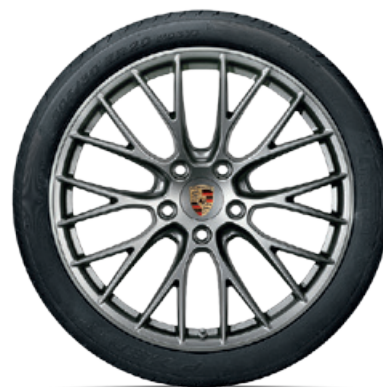
20-Zoll RS Spyder Design Rad

Erhältlich für alle 911 Carrera und 911 Carrera S Modelle (Typ 991 II). In anderen Abmessungen erhältlich für 911 Carrera 4 und 911 Carrera 4S Modelle (Typ 991 II). Erhältlich auch in Schwarz (hochglanz) und Platinum (seidenglanz).