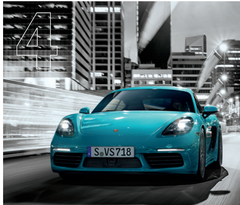
Mitten im Sport. Die neuen 718 Boxster und 718 Cayman Modelle.