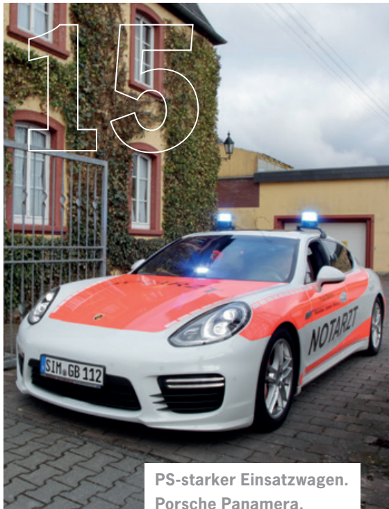
PS-starker Einsatzwagen. Porsche Panamera.